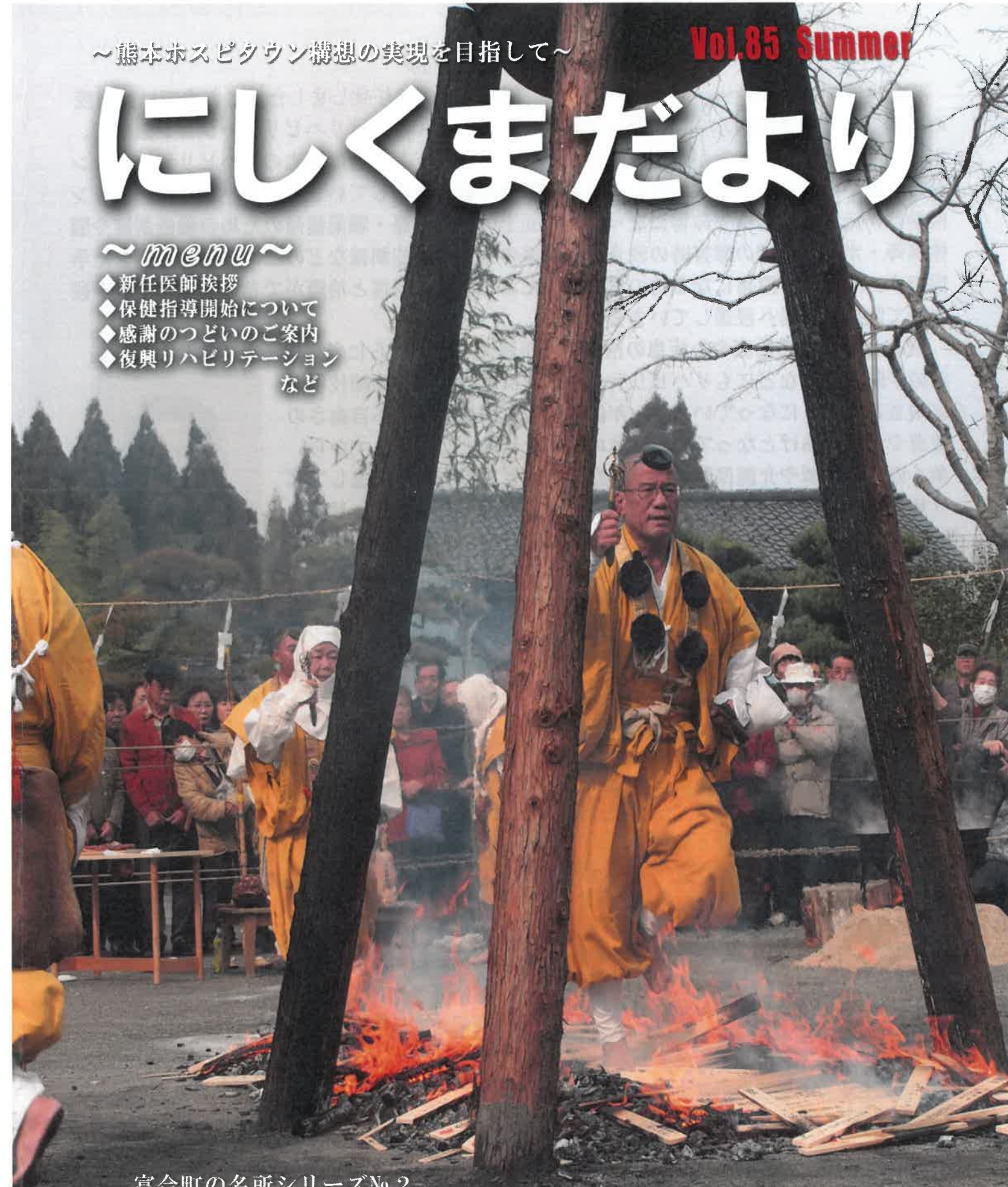
富合町の名所シリーズNo.2 「木原不動尊の火渡り行」

熊本市南区富合町にある木原不動尊は、約1200年前天台宗開祖・伝教大師最澄の御作と伝えられる不動明王を御本尊としており、千葉の成田不動尊及び東京の目黒不動尊と共に日本三大不動と並び称されています。毎月28日御縁日には、普段は秘仏のため扉がしめてある御本尊が開扉され、ことに2月28日の春季大祭には写真の火渡り・湯立ての荒行が行われ、多くの参拝者が訪れます。