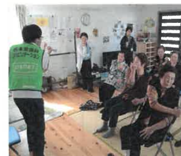
リハビリ風景 ※掲載の許可を頂いております

熊本市南区は、平成28年熊本地震の被害が熊本市の中でも大きかった地域であり、現在計7か所約450戸の応急仮設住宅があります。熊本県では各仮設住宅の入居者の皆様の生活不活発な状態となり介護を必要とする状態になる事を予防する目的で「復興リハビリテーション」活動を行っており、当院も熊本市南区の各仮設住宅でのサロン運営や連携会議等に参加させて頂いております。